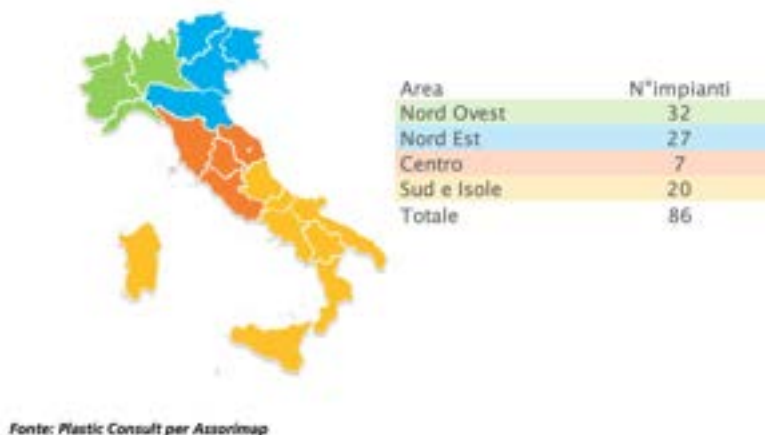
Numerosità e localizzazione dei riciclatori meccanici nazionali

L'industria privata del riciclo delle materie plastiche in Italia versa da anni in una profonda crisi strutturale. Quest'anno si prevede un completo azzeramento del fatturato, secondo i dati di Assorimap . Ma i problemi iniziano prima: dopo una brusca contrazione del fatturato (-28 per cento) registrata nel 2023 con 698,64 milioni di euro, già nel 2024 il comparto ha perso un ulteriore 0,8 per cento, attestandosi a poco più di 690 milioni di euro. A partire dal 2021, inoltre, gli utili di esercizio sono crollati dell'87 per cento, passando da 150 milioni di euro a soli 7 milioni nel 2023.